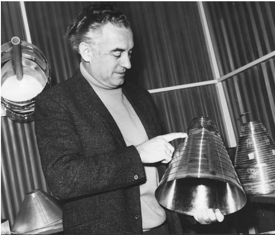
פרופ' זינגר עם הדגמים שבהם השתמש בטכניון לניסויי קריסת קליפות דקות דופן, באמצע שנות ה-70.

הושג מימון למחקרים עבור חיל האוויר האמריקני. במסגרת זו החל מחקרו של זינגר בתחום קליפות מבנה מחוזקות, שהפך לסמלה של הפקולטה בשטח המבנים. ממצאי מחקריו והניסויים שערך על גופים דקי דופן הוטמעו, לדוגמה, בתכן דופן השלב השני והשלישי של הטיל סאטורן 5, ששימש לשיגור חלליות אמפולו לירח.