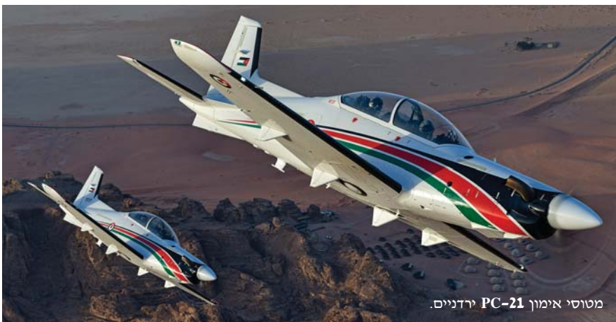
מטוסי אימון PC-21 ירדניים.

במסגרת התוכנית לחידוש פני חיל האוויר המלכותי הירדני, הציע החיל למכירה בספטמבר 2018 ארבעים וחמישה מטוסים ומסוקים, כדלקמן: שני מטוסי תובלה C295, מטוס תובלה אחד מדגם C-130B הרקולס, 17 מסוקי תקיפה מדגם AH-1F קוברא, 13 מסוקי UH-1H יואי, ותריסר מטוסי אימון סילוניים מסוג הוק 63.