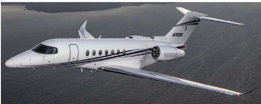
למעלה: ססנה 700 לונגיטיוד. למטה: אב-טיפוס של הפרטור 600, שמבצע טיסות ניסוי לקראת השגת רישוי.