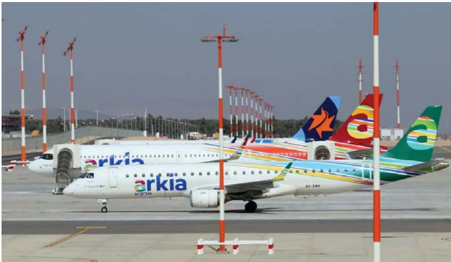
אמבראר E195 ואיירבאס A321LR neo של ארקיע, ואיירבאס A320 של ישראיר, ברחבת החנייה ברמון.