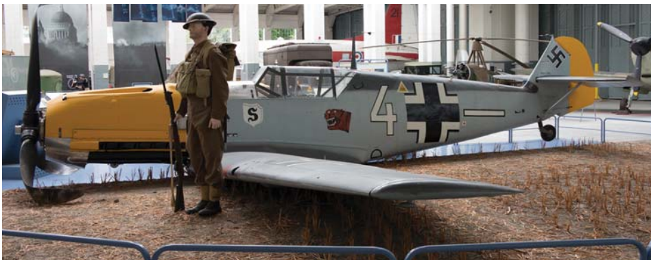
הקרב על בריטניה, האנגר 4

מסרשיט Bf 109E-3 : מטוס קרב זה של הלופטוואפה הופל על-ידי מטוסי הוריקן של חיל האוויר המלכותי ב-30 בספטמבר 1940 וביצע נחיתה גחון בשדה בסאקס.