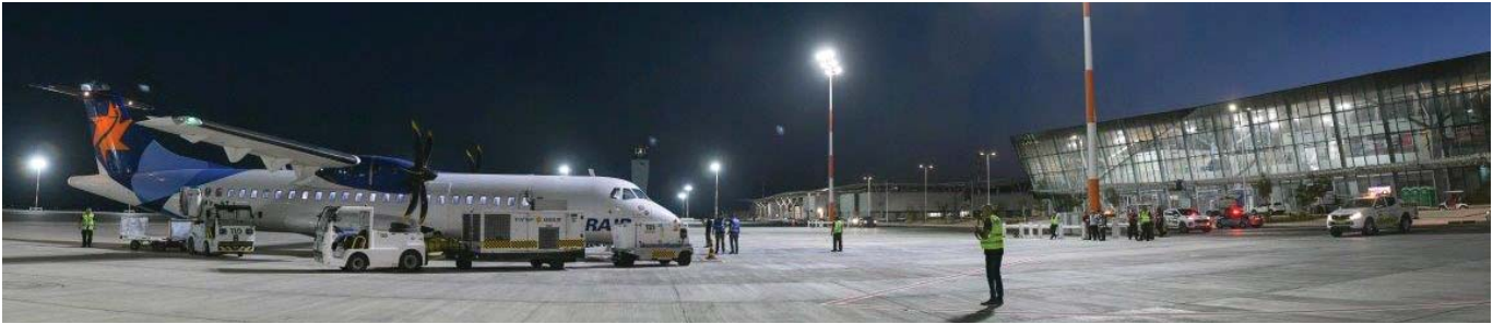
מטוס ATR-72 של ישראייר בנמל התעופה רמון. למטה: רוני רמון ז"ל ושר התחבורה והמודיעין ישראל כץ בטקס הסרת הלוט משם הנמל ב-16 ביולי 2018.