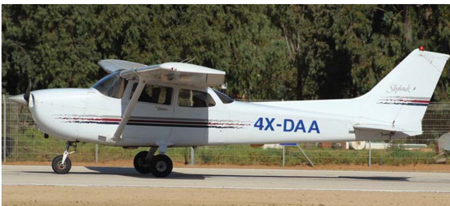
אחד משני מסוקי הסיקורסקי S-76C++ שמופעלים על-ידי להק תעופה מחיפה. למעלה: ססנה 172R סקיהוק בהרצליה.