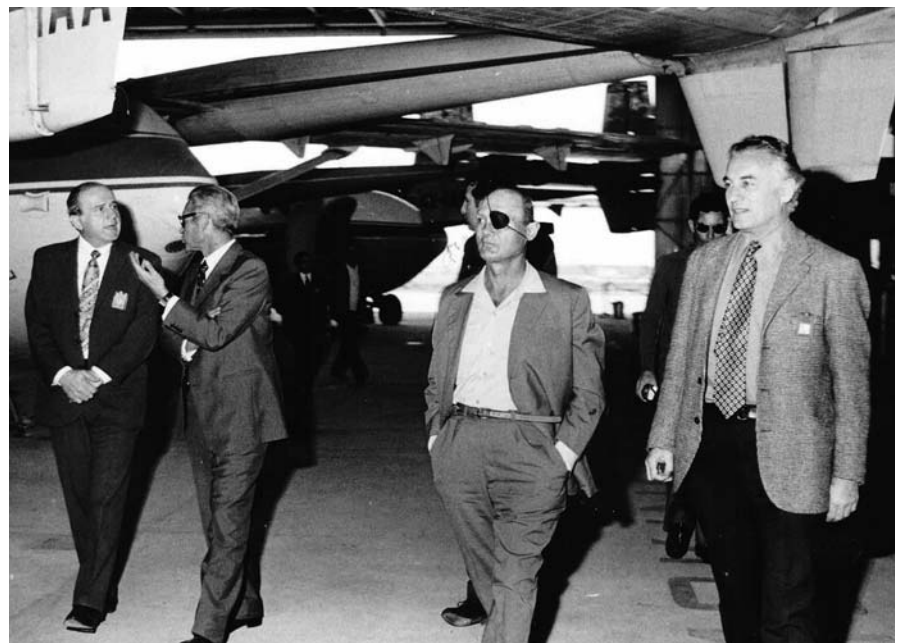
זינגר מלווה את שר הביטחון משה דיין בביקורו בקו ההרכבה של מטוסי הערבה בפברואר 1973.

בראשית שנות ה-60 החל זינגר לשתף פעולה עם התע"א כיועץ למחלקת הנדסה בראשותו של ד"ר אריך שצקי. הוא נטל חלק בבחינת ההיתכנות לפיתוח ה-B-101 – "מטוס פרטי סילוני" לשבעה נוסעים, עוד בטרם התקבע המונח "מטוס מנהלים" – על בסיס הפוגה מאגיסטר שיוצר ברישיון בחברה. שיתוף הפעולה עם התע"א התרחב בתקופת פיתוח מטוס הערבה, כאשר ניסויי המבנה הראשונים בוצעו במעבדת המבנים בטכניון. בהמשך נשלח צוות מומחים מהמעבדה לסייע לתע"א לפתח