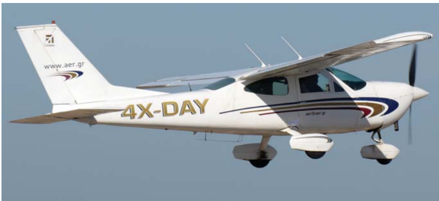
הססנה 177B קרדינל נרכש ממועדון תעופה ביוון ורישומו הקודם היה SX-ATM.

4X-CXY: מטוס אוורובטי מדגם אקסטרה EA300/L משנת ייצור 2010, שנרשם באוגוסט. שני מסוגו בישראל.