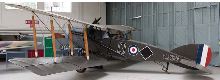
F2B פיטר : מטוס קרב דו-כנפי ודו-מושבי מתוצרת מפעלי בריסטול .

מטוס זה נכנס לשירות חיל האוויר המלכותי בספטמבר 1918 והוטס עד אפריל 1920. הועבר למוזיאון המלחמה האימפריאלי בשנת 1923, ולאחר מכן הוצג גם במוזיאון המדע בלונדון. לאחר שיקום ושיפוץ הוחזר למוזיאון המלחמה האימפריאלי ב-1953.