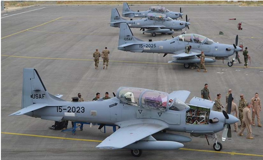
ארבעה מטוסי A-29B סופר טוקאנו הגיעו מארה"ב ללבנון ב-28 במאי 2018 כשהם מסומנים במספרי חיל האוויר האמריקני. בשירות חיל האוויר הלבנוני הם סומנו במספרים L713 עד L716.

מידע מפורט על סדר הכוחות של חיל האוויר הלבנוני פורסם בגיליון ינואר השנה של הירחון ההולנדי לתעופה Scramble, בעקבות ביקור של שני כתבים הולנדים בבסיסי החיל וסקירת המטס הגדול שנערך ב-22 בנובמבר 2018 לציון יום העצמאות ה-75 של לבנון.