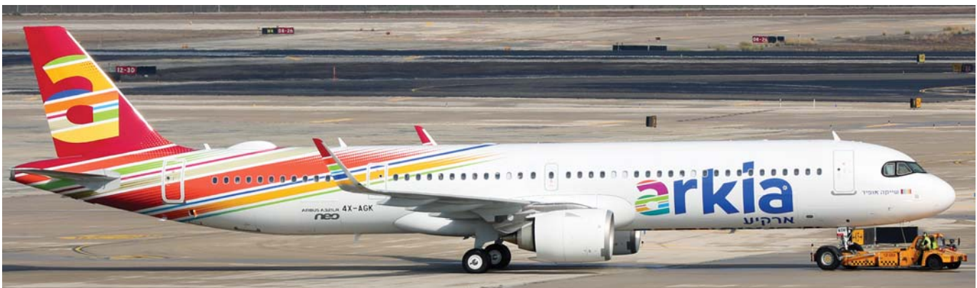
מטוס ה איירבאס A321-251NX השני של ארקיע , שנקרא על שמו של השחקן שייקה אופיר ז"ל, נחת בנתב"ג ב-20 בדצמבר.

בשנה החולפת נוספו בישראל 34 כליטיס מסחריים, פרטיים וספורטיביים מכל הסוגים – שלושה פחות מאשר בשנת 2017 (ראה "ביעף" e142 עמ' 13-16). הנתונים שקיבלנו מרשות התעופה האזרחית מצביעים על גידול משמעותי בכמות מטוסי הנוסעים החדשים שרכשו החברות אל-על, ארקיע וישראיר (תשעה מטוסים ב-2018, לעומת ארבעה בשנה הקודמת), וצמצום ניכר במספר כלי-הטיס הזעירים שנוספו בישראל (שבעה בלבד, לעומת 13 בשנה הקודמת). אנו מגישים להלן פירוט לפי סוגי כלי-הטיס, כפי שעשינו בשנים הקודמות.