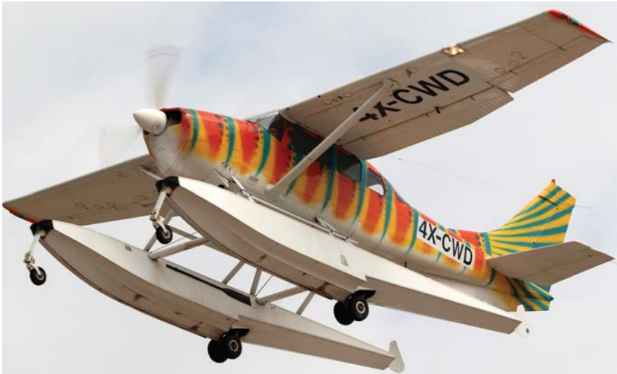
הססנה U206B סופר סקייוווגן על מצופים מופעל ממנחת ימי באילת.

ריטר – הבעלים של מועדון הצניחה החופשית Skydive ובית הספר לטיסה Mr. Pilot באילת – שהטיס אותו מאפריקה (ברישומו המקורי 5H-QIK) לאורך אלפי קילומטרים ונחת באילת ב-31 ביולי. לאחר הבאתו ארצה עבר המטוס שיפוץ יסודי בהרצליה. ריטר קיבל מרשות התעופה האזרחית רישיון להפעלת מנחת ימי במפרץ אילת, שממנו יופעל המטוס, ולאחרונה אושר לו גם לנחות בכנרת.