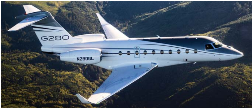
המטוס ה-105 בסדרת הייצור של ה-G280 משמש כיום כמטוס הדגמה של גאלפסטריים.