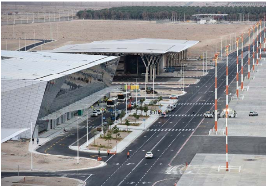
למטה: הכניסה היבשתית למסוף הנוסעים. למעלה: הצד האווירי של המסוף שממנו יוצאים למטוסים.