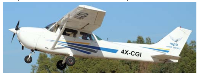
תמונות עליונות. ארבע התמונות התחתונות.