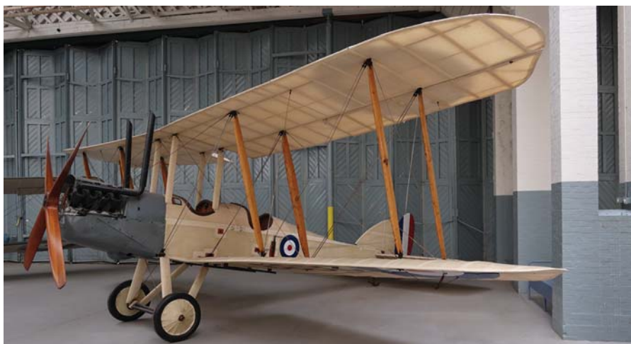
מטוסים מקוריים מתקופת מלחמת העולם הראשונה

BE2c : מטוס הסיור הדו-כנפי והדו-מושבי הזה יוצר בשנת 1915 במפעלי Royal Aircraft Factory . הופעל במסגרת מספר טייסות של חיל האוויר המלכותי בבריטניה. הוצא משירות במאי 1919 בעקבות נחיתת חירום.