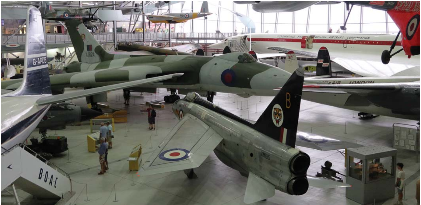
חלק מהתצוגה הצפופה בהאנגר 1. מאחור: מטוס הקדם-סדרה של הקונקורד. במרכז: המפציץ הסילוני וולקאן B2. מלפנים: מטוס הקרב העל-קולי לייטנינג F1.

האנגר 3 מציג מטוסים צבאיים תחת הכותרת "אוויר וים". בחלקו האחורי מוצגים מטוסים ומסוקים שהופעלו מסיפון נושאות מטוסים של הצי המלכותי יחד עם TBM אוונג'ר אמריקני המייצג את מטוסו של הנשיא המנוח ג'ורג' בוש משנת 1944. בחלקו הקדמי של האנגר מוצגים מטוסים דו-כנפיים וחד-כנפיים של חיל האוויר המלכותי מהמחצית הראשונה של המאה ה-20, דוגמת DH9, הוקר נימרוד,