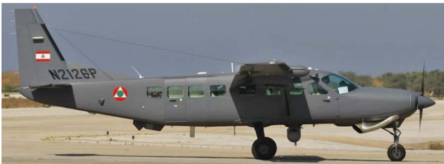
הססנה AC-208 קאראון הראשון שסופק ללבנון בשנת 2009. מספרו בחיל האוויר הלבנוני: L401.

12 מסוקי פומה, אחדים מהדגם המקורי SA330 שנקלט החל מ-1980 והאחרים מהדגם IAR330SM שיוצרו ברומניה. מסוקים אלה נתקבלו בחלקם מהאמירויות הערביות המאוחדות. אחד ממסוקי ה-IAR330SM