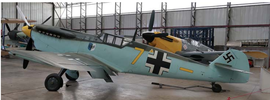
מטוסים בכושר טיסה בהאנגר 2

משמאל: שני מטוסי היספאנו HA-1112-M4L בושון – גרסה ספרדית של המסרשמיט Bf 109G, שיוצרה ב-1958 עם מנוע רולס-רויס מרלין.