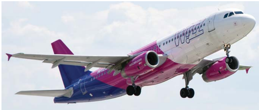
וויז אייר הטיסה בשנת 2017 יותר ממיליון נוסעים לנתב"ג וממנו, בעיקר במטוסי אירבאס A320 .

יוצאות מסנטיאגו בצ'ילה עם עצירת ביניים בסאו פאולו בברזיל. בטיסת הבכורה הגיע לנתב"ג בואינג 787-8 דרימליינר CC-BBF (בתמונה למטה), שנכנס לשירות החברה ביוני 2014. המטוס מסודר עם 30 מושבים במחלקת עסקים ו-217 מושבים במחלקת תיירים.