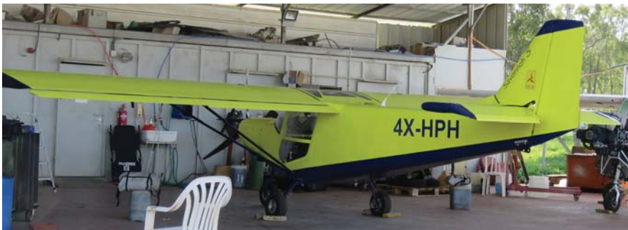
למעלה: הסאוונה S החדש במגידו. למטה: טכנאם P92E בטיסה.