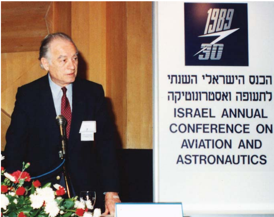
פרופ' זינגר בכנס השנתי ה-30 לתעופה ואסטרונאוטיקה, שהתקיים בפברואר 1989.

מצוי בשורת תארי הכבוד והפרסים שקיבל בערוב ימיו. אלה כללו תארי ד"ר לשם כבוד ממוסדות אקדמיים שונים, זכייה במדליית Maurice Roy מטעם ICAS על שיתוף פעולה בינלאומי באווירונאוטיקה, וכן זכייה בטבעת פראנדטל, שהיא אות ההצטיינות הגבוה ביותר של האגודה הגרמנית למדעי התעופה.