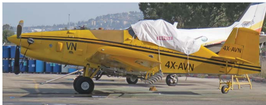
מטוס הריסוס איירס S2R-T34 טורבו תראש בשדה התעופה מגידו.

4X-HPH: סאוונה S מתוצרת החברה האיטלקית I.C.P., שנרשם בנובמבר.