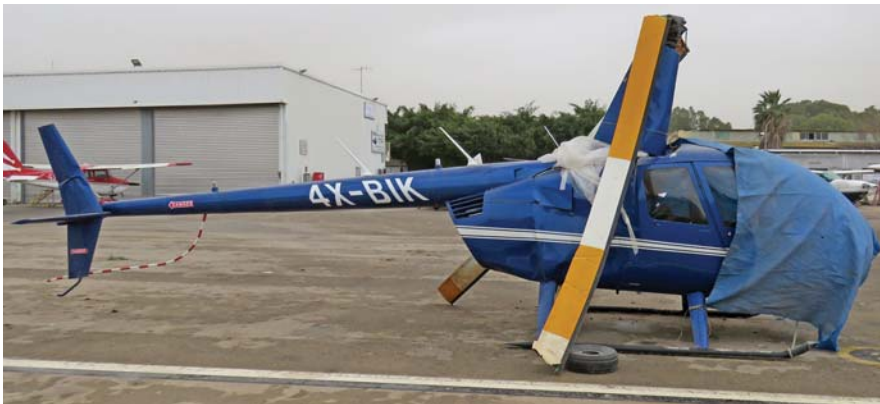
מסוק הרובינסון R44 רייון II קורקע בהרצליה לאחר התאונה שלו ב-12 בינואר 2019.